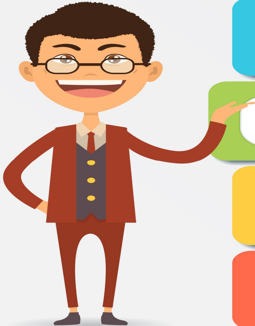
Схема рассмотрения обращений граждан в области здравоохранения